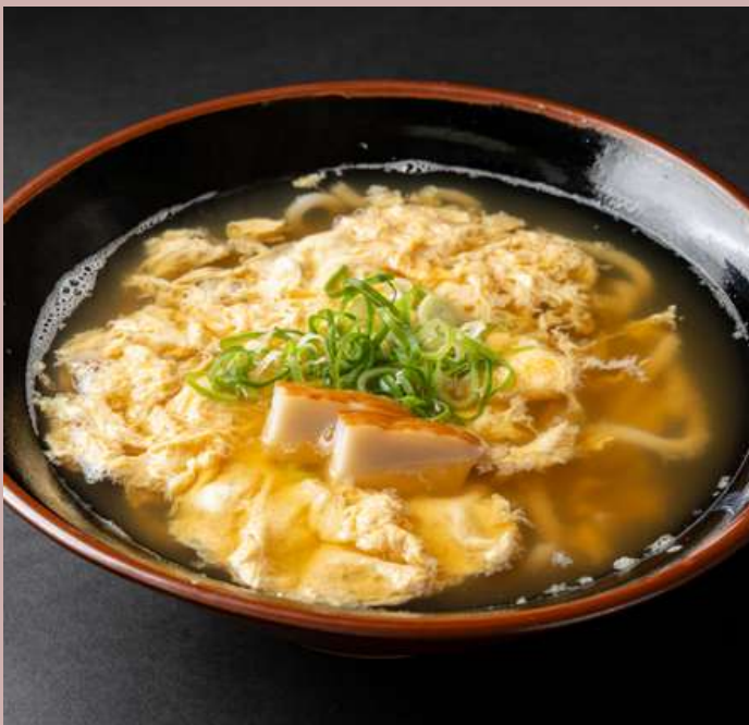
たまごとじうどん