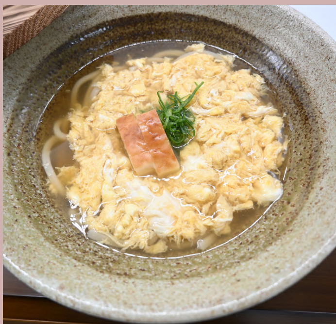
たまごとじうどん