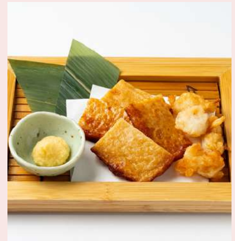
福岡の揚げ蒲鉾 900円