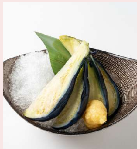
水茄子ぬか漬け 720円