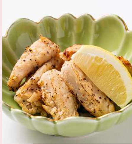
やげんなんこつ 880円