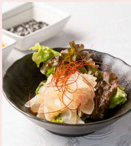
牛アキレスのボイル 770円