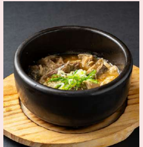
牛すじとモツ煮込み 1,680円