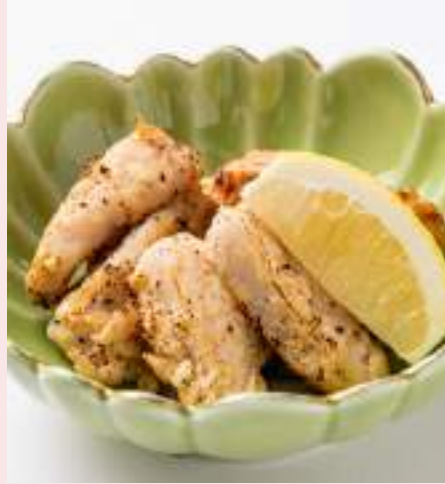
やげんなんこつ 880円