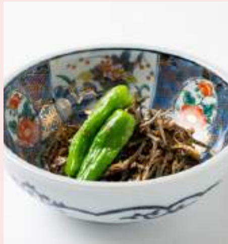
韓国風じゃこ炒め 620円