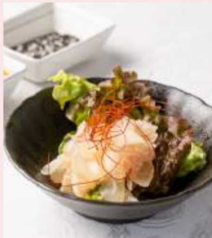
牛アキレスのボイル 770円