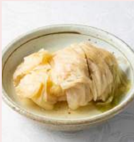
ハルピンキャベツ 750円