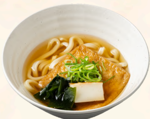
ミニうどん 又は そば 550円